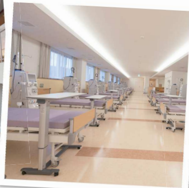
透析室も同じ建物内