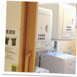
洗濯室は共用です