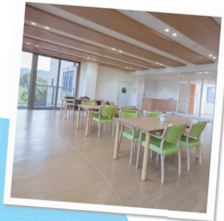
快適な お食事はラウンジで