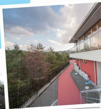
三永水源池の畔、 静かな環境