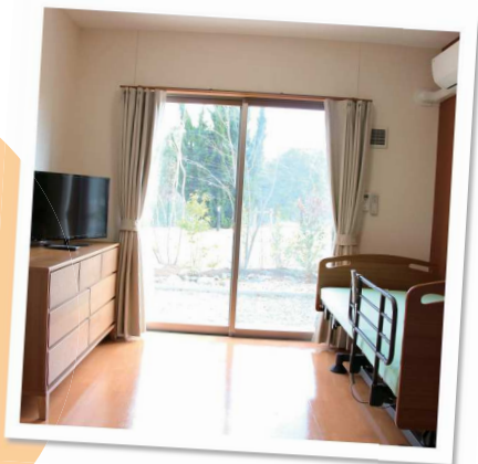
お部屋は家具・家電付き