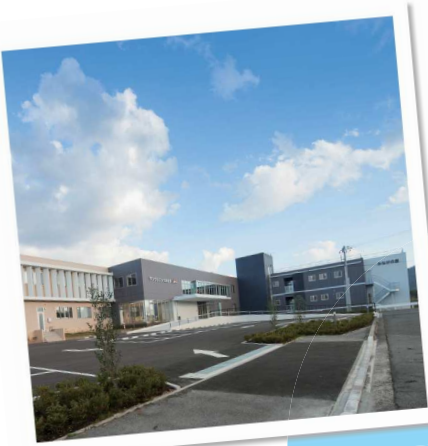
クリニックに併設