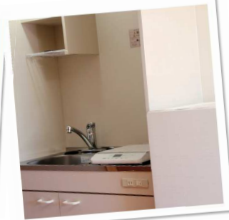
小さなキッチンも