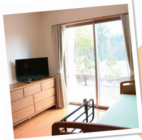
明るい陽の差す居室