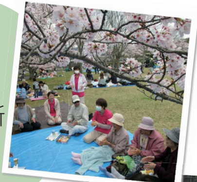
皆さまと 春のお花見