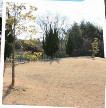
広いお庭はお散歩にも