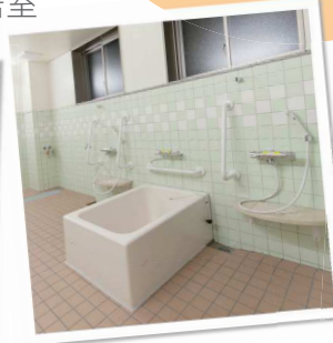
使いやすいバリアフリー仕様