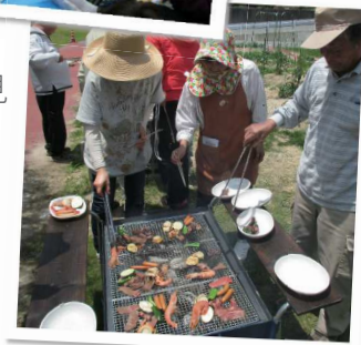
お庭で バーベキュー